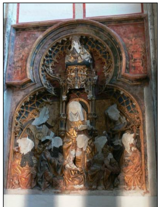
Vernielingen in de Utrechtse Dom

Dat de emoties hierover sterk opliepen bleek uit de gebeurtenissen tijdens de Beeldenstorm in 1566. Op oude illustraties is te zien hoe men vol overgave het interieur van de kerken sloopte: woedende personen trekken beelden omver, hakken met bijlen in op altaren, vernielen schilderijen, en verscheuren misboeken. Een plastisch voorbeeld hiervan bevindt zich in de dom van Utrecht, zetel van het bisdom waar Groningen vroeger toe behoorde: van een gebeeldhouwd reliëf, dat de graflegging van Christus verbeeldt, zijn alle hoofden afgehakt. In de provincie Groningen bleef het wat kalmer, maar ook hier werd in diverse plaatsen gestormd. Onder andere te Westeremden en Woltersum werden beelden kapot gegooid en altaarstukken en misboeken vernield. Daarnaast verknipte men in Oosternieland ook kerkelijk textiel zoals een