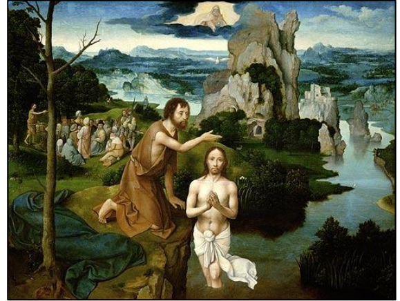
Joachim Patinir, Het doopsel van Christus , 1510/1520, Olie op doek, Kunsthistorisches Museum, Wenen.

Binnen het christendom is het doopsel of de doop het sacrament van de christelijke initiatie. De dopeling wordt besprenkeld met doopwater, of ondergedompeld in een bad. Na het doopsel mag je in sommige kerkgemeentes deelnemen aan andere sacramenten, zoals de communie. Tot de Reformatie voltrok de doop zich aan de 'duivelse' westkant van de kerk. Daar stond dan een doopvont dat meestal gemaakt was van brons of steen. Na de doop verliet de dopeling de kerk aan de oostzijde, de godszijde van de kerk. In 1992 vond men aan de westkant van de middeleeuwse Jacobuskerk in Feerwerd de restanten van een doopvontfundament. Dit is een bijzondere vondst die in Groningen bijna nooit eerder is voorgekomen.