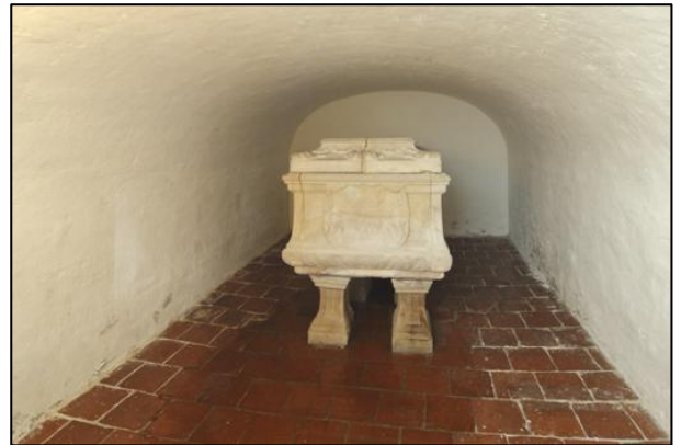
Praalgraf Margaretha van Cobenzl

Sinds 1730 ligt in de grafkelder in de Liudgerkerk een Weense gravin begraven. Eeuwenlang lag ze ongestoord onder de kerk en was ze in de vergetelheid geraakt, maar in 1969 kwam ze wegens graafwerkzaamheden in de kerk weer aan het licht. Ze werd aangetroffen in een zandstenen praalgraf. De grote vraag is natuurlijk waarom deze gravin het in haar hoofd haalde om de Weense salons te verruilen voor de Groningse klei.