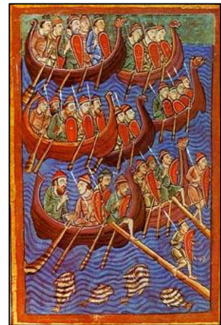
De Vikinginvasie van Engeland onder Hinguar en Hubba. Detail uit 'Life, passion and miracles of St. Edmund, King and Martyr', ca. 1130.

Waarschijnlijk is dat de noordelijke deur zijn oorsprong vindt in de manier waarop de mis werd gevierd. De meeste kerken hadden oorspronkelijk twee deuren, een gebruik dat mogelijk uit het Angelsaksische gebied is overgewaaid. Men kwam via de koude noordkant de kerk binnen. Bij het uitgaan kwam men dan na de mis bij de zonnige zuidzijde weer naar buiten, wat een gevoel van verlichting teweeg moet hebben gebracht. Een slim psychologisch trucje om de loutering van de mis extra kracht bij te geven. De noord- en zuidzijde speelde in het kerkelijke leven een grote rol. Ook was de noordzijde wel de kant van de duivel. Het noorden werd aangewezen als plaats waar de duivel zou huizen. Zo werden misdadigers aan de noordkant begraven. Bij de doop zou het kind door de noordzijde naar binnen zijn gebracht, om gezuiverd van zonden na de doop, aan de zuidzijde weer naar buiten te komen.