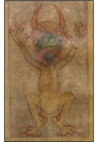
Illustratie van de duivel uit de Codex Cigas, vroege dertiende eeuw, folio 290.

Een andere verklaring is dat de kerk oorspronkelijk een mannen- en vrouweningang had. De vrouwen moesten door de 'duivelse' noordelijke kant naar binnen, wat zou verwijzen naar de erfzonde van Eva. Door de vrouw was de zonde immers de wereld in gekomen, zo geloofde men. Oorspronkelijk zaten mannen en vrouwen tijdens de dienst gescheiden, een gebruik dat in de katholieke kerken tot in de jaren zestig is gehandhaafd. In protestantse kerken raakte het echter in onbruik en werd vaak een van beide deuren, meestal de noordelijke, dichtgemetseld. Dat de deuren zo laag zijn, te laag om te gebruiken, komt waarschijnlijk gewoon doordat de grond van het kerkhof in de loop der jaren door begrafenissen werd opgehoogd. De kerk kreeg dan meestal een nieuwe, hogere deur aan de zuidzijde.