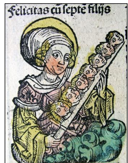
De heilige Felicitas

Waar de naam Germaniaklooster vandaan komt is niet duidelijk. Er is namelijk geen heilige bekend met deze naam. Wellicht is Germania een verbastering van de