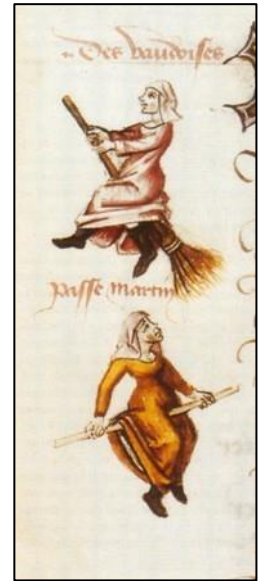
Des vaudaises, uit Le Champion des Dames, 1451, Bibliothèque nationale de France, Parijs.

Deze pastoor was Rumbertus Bouwsema. Over Rumbertus deden vreemde verhalen de ronde. Men vertelde dat hij een dubbelganger had. Rumbertus werd soms op twee plaatsen tegelijkertijd gezien. Dit alles had waarschijnlijk te maken met een conflict over een stuk land. Toen hij in 1556 aanspraak maakte op een omstreden stuk weiland, liep hij rond het perceel en proefde het water uit de sloten en kolken en zelfs de bierput. Dit kwam hem duur te staan: pachters beschuldigden hem van toverij. De kaas die gemaakt werd met het water mislukte namelijk en hun kinderen kregen na het drinken van het slotwater diarree. Het proeven van water was een ritueel dat hoorde bij eigendomsoverdracht van land. Buurrechters moesten voor hun beëdiging het land op hun duimpje kennen. Ze moesten eerst een rondgang om het