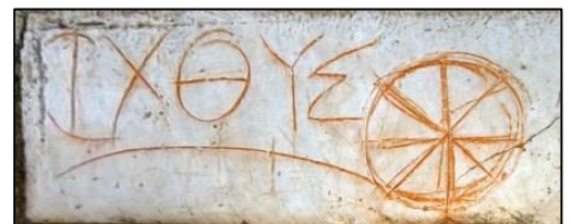
Ichtus en het wagenwiel

De vis is een bekend christelijk symbool. Vroege christenen gebruikte het als geheim teken. Tijdens de Christenvervolgingen in de Romeinse staat gebruikten de gelovigen neutrale tekens, die door niet-christenen op het eerste gezicht niet als christelijk konden worden herkend. Binnen de eigen kring was de betekenis wel bekend en de symbolen werden dan ook gebruikt om erachter te komen of iemand (ook) een christen was. Later bleef het symbool in gebruik. De naam van dit symbool is 'Ichtus', het Griekse woord voor vis. De vis staat in verband met de doop in het water, maar het visje verwijst ook over de verhalen over de wonderbare visvangst. Elke letter van het woord Ichtus, in het Grieks ιχθύς, staat voor de eerste letter van de zin die voor de Christenen de basis van hun geloof vormde: Jezus CHristos, THEau Uios, Soter (Jezus Christus, zoon van God, verlosser). Als je deze letters over elkaar heen schrijft krijg je een ander christelijk symbool: het wagenwiel.