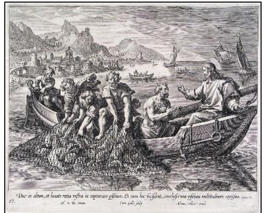
De wonderbaarlijke visvangst

Ze werden de eerste apostelen. De variatie en hoeveelheid aan vis die ze ineens vingen nadat Jezus hun had toegesproken, die de boten tot zinken toe vulden, symboliseerde zo de verscheidenheid aan mensen die het Christendom zouden omarmen. Christus wordt in die zin aangeduid als 'de grote visser' en de gelovigen als de picini, de kleine visjes. Voor een vissersdorp als Visvliet moeten zulke verhalen een bijzondere betekenis gehad hebben. Voor christenen is de vis een belangrijk symbool gebleven die je niet alleen in kerken tegen kunt komen, maar zelfs op de bumper van auto's.