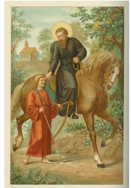
'En Liudger deed Bernlef zien'

Bernlef stemde hiermee in en reisde met hem mee om het geloof te verkondigen. Zijn liederen en bijzondere stem waren hierbij een fantastisch hulpmiddel. Dus dankzij de wonderbaarlijke genezing van de bard slaagde Liudger erin de Groninger bevolking tot het christendom te bekeren. Of het verhaal nu waar is of niet, er blijkt in ieder geval uit dat Liudger over een groot menselijk inzicht beschikte. Door niet alleen bevriend te raken met de lokale elite, maar ook een lokale beroemdheid te gebruiken op zijn missie, wist hij zo het vertrouwen van de lokale bevolking te winnen. Hij stichtte veel kerken, onder andere de kerken in Leens, Loppersum, Baflo en Farmsum. Ook op de wierde van Helwerd werd een kerk gesticht. Hier is niets meer van over. De wierde Helwerd ligt verlaten in het land, als stille getuige van een belangrijke gebeurtenis in de Groninger geschiedenis.