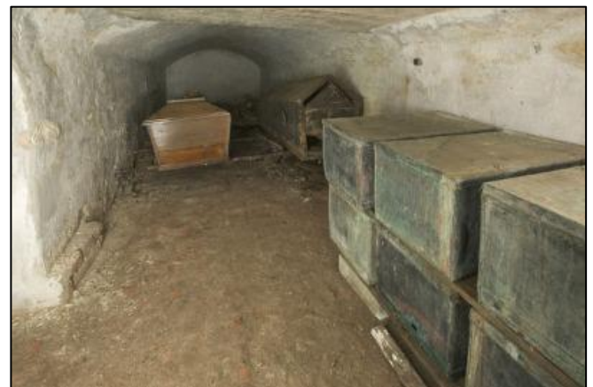
De grafkelder van Midwolde

Anna van Ewsum, die zelf 74 jaar oud werd, leek wel te worden achtervolgd door de dood. Niet alleen verloor ze haar beide echtgenoten, maar ook al haar kinderen op jonge leeftijd. De kleine kistjes in het grafgewelf werden daarom lange tijd aangezien voor de lijkstjes van deze kinderen. Dit bleek een legende te zijn: opschriften op de kistjes wezen uit dat ze de resten bevatten van personen uit de families Van Ewsum en Van In- en Kniphuisen. Zij waren oorspronkelijk op verschillende plaatsen elders begraven, maar op zeker moment allen verzameld en in het familiegraf te Midwolde