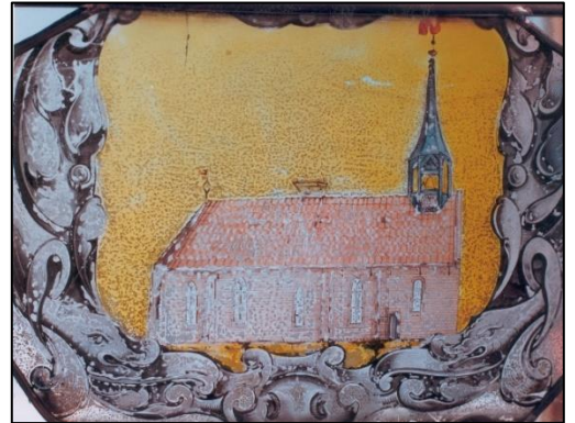
Gebrandschilderd raam in de kerk van Niehove

In de kerk van Niehove bevindt zich een oud deel beschilderd glas waarop de kerk is afgebeeld. Het venster is een overblijfsel van de gebrandschilderde ramen die vermoedelijk gemaakt zijn in het derde kwart van de zeventiende eeuw. Op het dak van de kerk is een paal te zien met daarop een groot ooievaarsnest. Eind negentiende eeuw werd het raam verwijderd, volgens de notulen 'ter voorkoming dat de projectielen der veelbelovende schooljeugd, welke er reeds eenige beschadiging aan hebben toegebracht het geheel zullen vernielen.' Het raam heeft een bijzondere betekenis voor de kerk van Niehove. Ooit waren ooievaars namelijk graag geziene gasten van de kerk. Het nest werd in stand gehouden door de parochianen en zou zich al vanaf de vijftiende eeuw op het dak hebben bevonden.