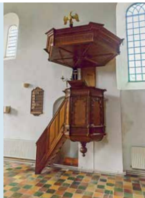
PREEKSTOEL (17E EEUW)