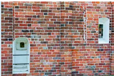
KNIELNIS MET HAGIOSCOOP

ORGEL De kerk kreeg in 1879 een orgel, gebouwd door Petrus van Oeckelen, maar na diens dood geplaatst door zijn zoons. Het pijpwerk en de windladen zijn ouder (circa 1845), maar wel van de hand van Van Oeckelen. Het bescheiden instrument met 1 klavier en aangehangen pedaal bezit 7 registers, en heeft een fraaie, milde klank. De dispositie luidt: Prestant 8' Bourdon 8' Viola di Gamba 8' Octaaf 4' Quint 3' Woudfluit 2' Violoncel 16' (discant). In 1961 is tijdens een kerkrestauratie de bekroning en het snijwerk van de kas verwijderd. D. Mulder restaureerde het instrument in 1962 en plaatste een elektrische windmotor. In 1999 werd het orgel gerestaureerd door de firma Van der Putten. De orgelkas is daarbij opnieuw geschilderd in de oorspronkelijke kleur, en ook het lofwerk is teruggezet.