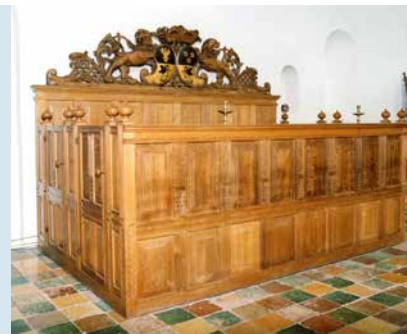
HERENBANK (17E EEUW)