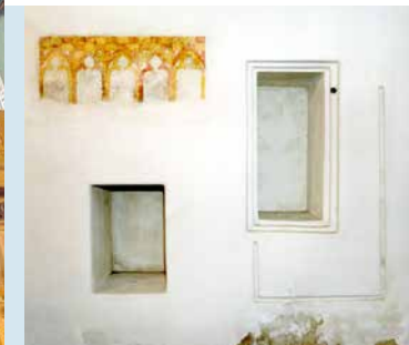
MUURSCHILDERING; HET LAATSTE AVONDMAAL, 1E SCHILDERING VAN DE KRUISWEG, DAARNAAST DE SACRAMENT NIS