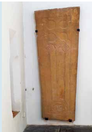
SARCOFAAGDEKSEL (13E EEUW)