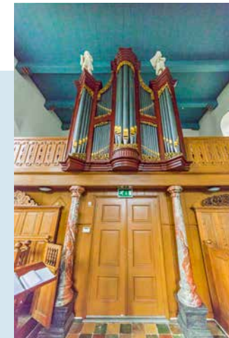
VAN OECKELENORGEL (19E EEUW)