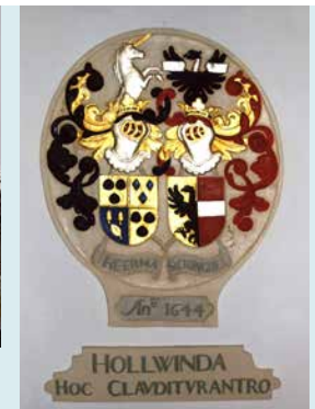
INGEMETSELD WAPENSCHILD 1644