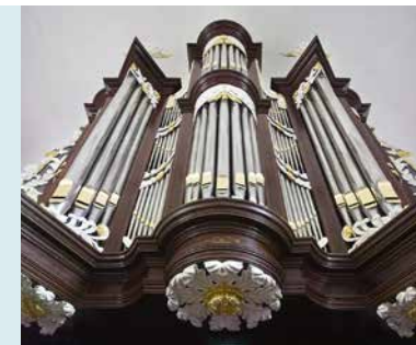
VAN OECKELEN ORGEL UIT 1852