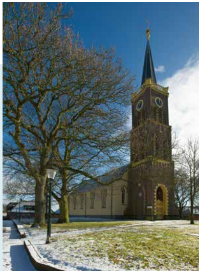
KERK MET TOREN 2016

De eerste generaties kerken waren houten kerken, maar in de 11e/12e eeuw werd in Usquert een tufstenen zaalkerk gebouwd in romaanse stijl. Deze kerk kent een bewogen geschiedenis. Zo werd hij in 1231 door brand verwoest bij regionale twisten tussen de Uithuizers (Fvelingoërs) en Eenrummers (Hunsingoërs). Een kluizenaar “van goeden naam” kwam hierbij om het leven. Gedwongen door de banvloek van bisschop Ludolf, later bekrachtigd door paus Gregorius IX, schonken de Eenrummers geld, waardoor de kerk in laatromaanse stijl herbouwd kon worden.