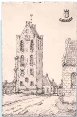
OUDE TOREN VOOR DE AFBRAAK IN 1868