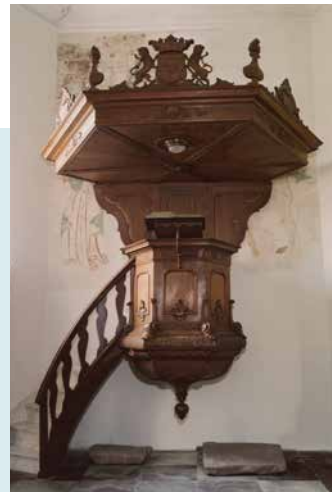
KANSEL UIT 1755