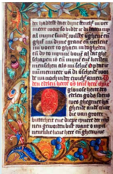
GETIJDENBOEK THESINGE OMSTREKES 1515