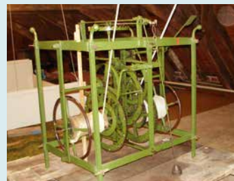
UURWERK WORDT DAGELIJKS OPGEWONDEN