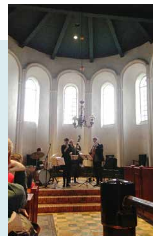
KERK ALS PODIUM, RUIMTE VOOR KUNST EN CULTUUR

stelling ingericht. In de vorige eeuw zijn bij opgravingen buiten het dorp Thesinge drie sarcofaagdeksels gevonden. Twee van de drie deksels worden in het baarhuisje tentoongesteld met extra informatie. In de kerk ligt, naast een historische wandelroute, een wandelroute die naar de vindplaats van de sarcofaagdeksels leidt. Ook vindt u in het baarhuisje informatie over het schrijven in kloosters. Het Thesinger klooster had in het begin van de 16e eeuw een belangrijk schrijfatelier (scriptorium). Met de hand geschreven en fraai geïllustreerde gebedenboekjes worden in de Universiteitsbibliotheek van de stad Groningen bewaard. In de kerk is tevens een kleine uitgave met de titel 'Het schrijven in Kloosters' te vinden. Het baarhuisje is net als de kerk in de zomermaanden dagelijks open voor publiek.