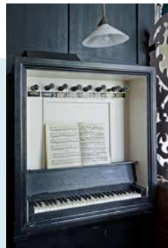
ORGEL GEBOUWD DOOR ROELF MEIJER IN 1873