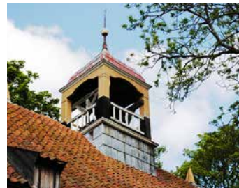
DAKRUITER MET LUIDKLOK

Deze tekst uit 1644 staat op een architraaf van een vroeger koorhek en is gebruikt als spantbalk in de dakconstructie en helaas niet gemakkelijk zichtbaar.