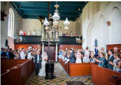
TROUWEN IN DE KLOOSTERKERK IS EEN FEEST

De kleine avondmaalstafel valt nauwelijks op. Bij het maken van de tafel in 1786 is gebruik gemaakt van ouder materiaal. Drie regels onder het tafelblad zijn versierd met snijwerk in motieven uit de tweede helft van de 17e eeuw, de vierde regel is een povere nabootsing. Het tafelblad is van imitatiemarmar, evenals de pilaren onder de orgelgalerij. Het orgel werd in 1873 door Roelf Meijer gebouwd. Het is een klein orgel met een bijzondere klank.