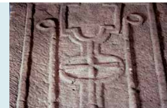
SARCOFAAGDEKSELS, LIGGEN IN HET BAARHUISJE