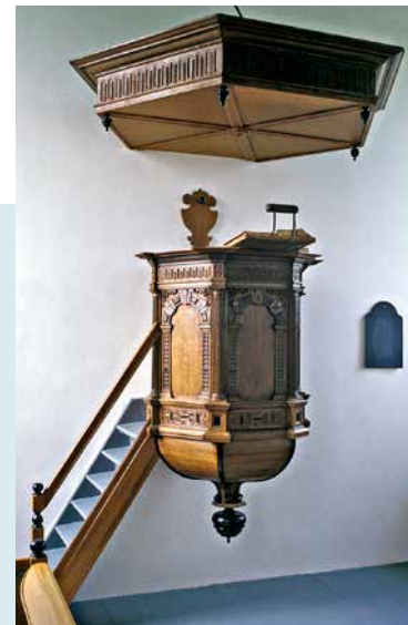
PREEKSTOEL TWEDE KWART 17E EEUW

In de vloer van de kerk liggen, deels zichtbaar, deels onder de houten vloer verborgen, verscheidene grafzerken, de oudste uit 1639.