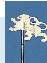
LEEUEW ALS WINDVAAN

PATROONHEILIGE De kerk is gewijd aan St.-Georgios ofwel St.-Joris. Deze heilige uit de 4de eeuw is in Groningen bekend als Sint-Joris van de legende van de Draak. In deze legende wordt verteld hoe Joris een draak doodde die mensenoffers verslond.