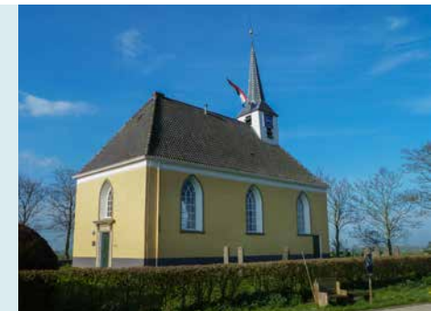
KERK GEZIEN VANUIT HET NOORD-OOSTEN