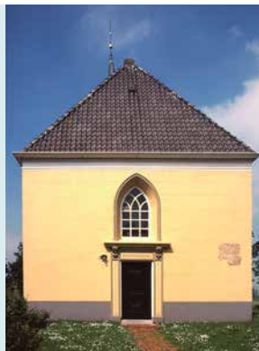
OOSTELIJKE MUUR MET DEUR

INTERIEUR Het sobere interieur wordt gedekt door een blauwgroen geschilderde vlakke zoldering waarvan de balken zijn versterkt met sleutelstukken.