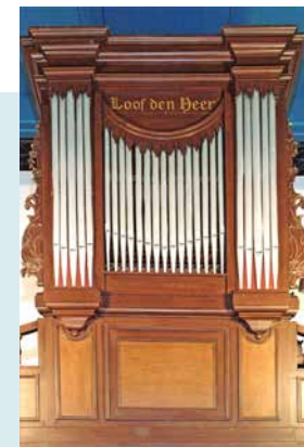
DE FRIESE ORGELBOUWER ADEMA PLAATSTE IN 1942 HET ORGEL IN DE KERK. HET INSTRUMENT HEFT ÉÉN MANUAAL MET ACHT STEMMEN.