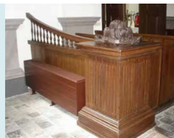
HET DOOPHEK WORDT AFGESLOTEN DOOR TWEE UITZONDERLIJK ZWAAR VORMGEGEVEN POSTEN BEKROOND MET SNIJWERK.