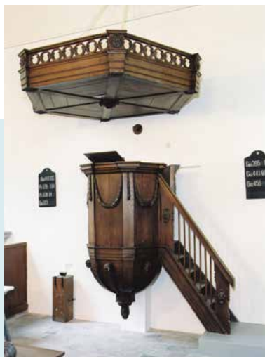
EEN EENVOUDIG UITGEVOERDE PREEKSTOEL IN DE LOUIS SEIZE STIJL.