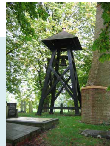
DE HUIDIGE KLOKKENSTOEL IS IN 1975 GEPLAATST. DE KLOK DIE ER NU HINGT IS IN 1948 GEGOTEN EN GEÏNSTALLEERD DOOR KLOKKENGIETERIJ VAN BERGEN UIT HEILIGERLEE.