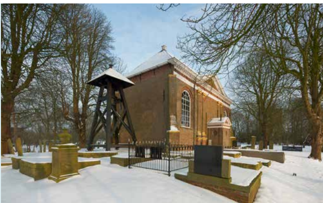
NEOKLASSIEK KERKJE 1783 VOORZIEN VAN FORSE STEUNBEREN OP DE HOEKEN.

KLOKKENSTOEL De huidige klokkenstoel is in 1975 geplaatst. In de oude klokkenstoel hing een klok geschonken door collator Geardus van Stedum en werd in 1943 door de Duitse bezetter onvreemd. De huidige klok is in 1948 door collectes en giften uit de toenmalige Nederlandse Hervormde gemeente Solwerd geschonken aan de kerkvoogdij. De klok heeft een middellijn van 67 cm, hoogte 52 cm en is gegoten in de gieterij van Van Bergen te Heiligerlee.