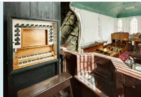
SPEELTAFEL HUIDIGE ORGEL