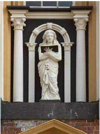
BIJBELLEZENDE VROUW BOVEN DE HOOFDINGANG

In elk geval is in de kerk nu nog één restant van het oude orgel over: de fraai bewerkte uitgebouwde zitplaats (cedile) links naast het huidige orgel.