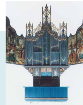
ORGELFRONT OUDE ORGEL 1526