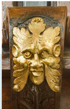
KOPJE AAN PREEKSTOEL "DE GROENMANNEN"