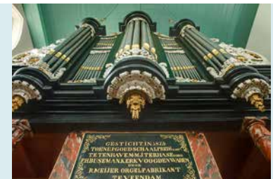
ORGELFRONT HUIDIGE ORGEL 1874