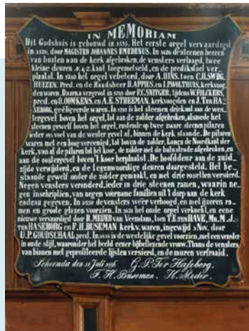
MEMORIEBORD BOVEN DE KOORAFSLUITING 1896