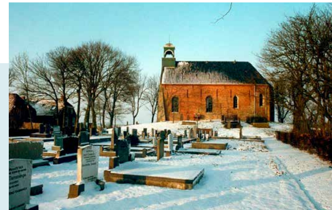
ZUIDGEVEL VAN DE KERK

OUDE WEEM Opmerkelijk is de betonbrug tussen de oude pastorie (de weem) en de kerk. Deze is in 1932 aangelegd als de bestaande pastorie de functie krijgt van kosterwoning en consistorie van waaruit de predikant en de kerkenraad de kerk binnentreden.