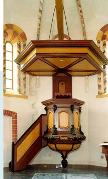
EIKENIMITATIE PREEKSTOEL 1773

INTERIEUR Het 18e-eeuwse kerkmeubilair is in goede staat bewaard gebleven en staat opgesteld volgens 19e-eeuwse gewoonte. De preekstoel heeft een eikenimitatie en werd in 1773 vervaardigd, de avondmaalstafel is uit dezelfde eeuw. In het interieur bleef de overwelfing in steen door middel van vier koepelgewelven bewaard. De gewelven zijn verfraaid met ronde ribben die samen komen in 'stervormige sluitringen'. De beschildering van de ribben is gevarieerd en in twee perioden tot stand gekomen: baksteenimitatie in de 13e eeuw en de geometrische vullingen van de gewelfkruinen in de 15e eeuw. Ook bijzonder zijn de zogenaamde wijdingskruisen, die werden aangebracht na de wijding of de herwijding van de kerk na restauratie. De kerk kent er een aantal. Er zijn diverse rondboogvensters en hagioscopen, maar aan de muren is te zien dat er meer moeten zijn geweest.