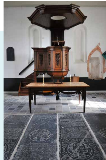
GEZICHT OP HET KOOR.