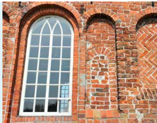
EEN VERGROOT VENSTER MET DAARNAAST IN EEN NIS EEN GEDICHT VENSTER. RECHTS EEN NIS MET SIERMETSELWERK.