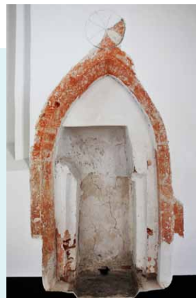
BIJ DE RESTAURATIE VAN DE KERK TERUGGEVONDEN PISCINA MET HIERBOVEN EEN FRAGMENT VAN EEN GESCHILDERD WIJDINGSKRUIS.

INTERIEUR De kerk moet ooit in steen overwelfd zijn geweest. Daarop wijzen de muurdikte en een spoor van een gewelfaanzet aan de noordzijde van de kansel. De gotische piscina met geschilderde omranding aan de zuidzijde in de koorluiting werd tijdens de restauratie midden jaren tachtig ontdekt. Boven de spitsboog van deze piscina kwam een wijdingskruis voor de dag. Ook kwamen er over de volle lengte van de zuid- en noord-muur geschakelde korfbogen aan het licht. De kansel is laat 18e-eeuws en heeft op de kuippanelen de symbolen van de vier jaargetijden: bloei voor de lente, korenaren voor de zomer, druiven voor de herfst en schaatsen voor de winter. De avondmaalstafel is in Lodewijk XVI-stijl. Hij werd in 1809 gemaakt door Lieuwe Hendriks Hemminga uit Beetsterzwaag. De herenbanken zijn 18e-eeuws, de rest van de banken dateert uit 1863.