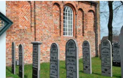
ZUIDGEVEL MET GRAFFALLEN VAN BELGISCH HARDSTEEN.