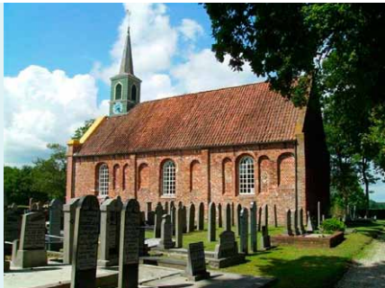
KERK GEZIEN VANUIT HET ZUIDEN.

Architect T. Glastra uit Marum bouwde in 1906 een nieuw portaal voor de kerk en gebruikte hiervoor waalsteen i.p.v. rode Groninger baksteen. Het portaal heeft evenals de gevel aan weerszijden pilasters, bekroond met smeedijzeren ornamenten. De klok dateert uit 1777 en werd gegoten door J. Borchard te Enkhuizen. Het eerste uurwerk werd in 1879 gemaakt door de instrumentmaker H. Deutgen uit Groningen. De in 1916 wegens bouwvalligheid nieuwgebouwde toren kreeg een uurwerk van de firma Weule uit Bockenem in het Hartzgebirge.