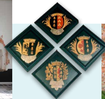
IN DE KERK HANGEN TWAALF RUITVORMIGE ROUWBORDEN, GEMAAKT VOOR LEDEN VAN DE FAMILIES VAN TEIJENS EN VAN FOCKENS. ZE KOMEN UIT DE KERK VAN BEETSTERZWAAG.