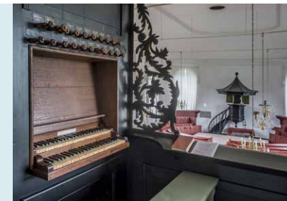
ORGELKLAVIER MET UITZICHT OP KERKZAAL