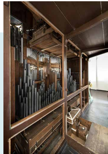
ORGELKAS MET BINNENWERK