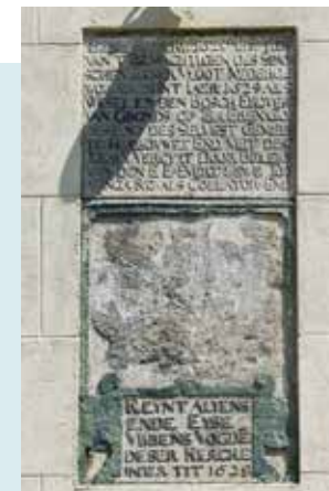
GEVELSTEEN AAN DE (BUITEN) WESTMUUR HERINNERD AAN DE VERBOUWING VAN DE KERK IN 1628.