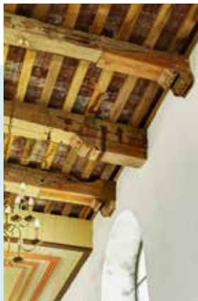
GEDEELTELIJKE BAKSTENEN ZOLDERING VAN VOOR DE 19E EEUW.