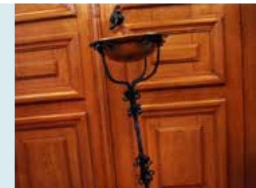
OFFERSCHAAL OP SMEEDIJZEREN VOET.