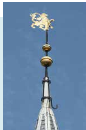
LEEUW OP DE TORENSPITS VERWIJST NAAR DE FAMILIE LEWE, BEWONERS VAN DE ALSINGABORG TE ULRUM.