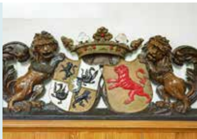
FAMILIEWAPENS OP DE HERENBANK VAN DE FAMILIES LEWE EN VAN INN EN KNIPHUIZEN COLLECTOREN VAN DE KERK.

ORGEL Het orgel is in 1883 gebouwd door Petrus van Oeckelen. Er zijn sindsdien geen belangwekkende ingrepen aan verricht, zodat het in originele staat is. Het heeft boven de rijtoetsen negen registerknoppen voor acht registers en een windlosser. Het orgel heeft een prachtige Bourdon 16 voet met een lage klank. Het heeft drie 8-voets registers, een prestant, een holpijp die klinkt als een soort fluit en een viola da gamba die de klank heeft van een cello. Het orgel heeft twee 4-voets registers: een octaaf 4 en een fluit 4. Ten slotte heeft het orgel een bijzonder cornet, opgebouwd als een mixtuur als op grote orgels.