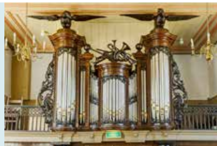
ORGELFRONT VAN HET ORGEL GEBOUWD DOOR FA. P. VAN OECKELLEN EN ZONEN IN 1883.