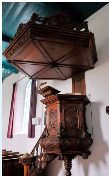
PREEKSTOEL EN FRAAIE TRAP MET BALUSTERS IN SCHIJNPERSPECTIEF.