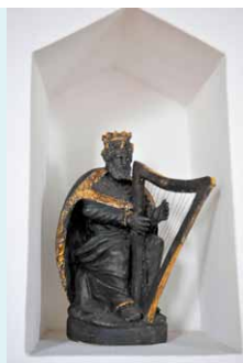
BEELDJE HARPSPELENDE KONING DAVID, AFKOMSTIG VAN VERDWENEN KABINET-ORGEL.