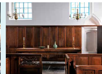
GEZICHT OP HET KOOR MET RECHTS DE TERUGGEVONDEN EN GERECONSTRUEERDE PISCINA.