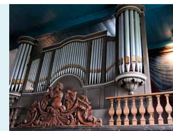
SCHIJNFRONT ORGEL UIT 1941, AANGEPAST AAN DE PUTTO UIT 1743, MET HIERACHTER HET IN 1941 AANGESCHAFTE ORGEL UIT ST. ANNAPAROCHIE.