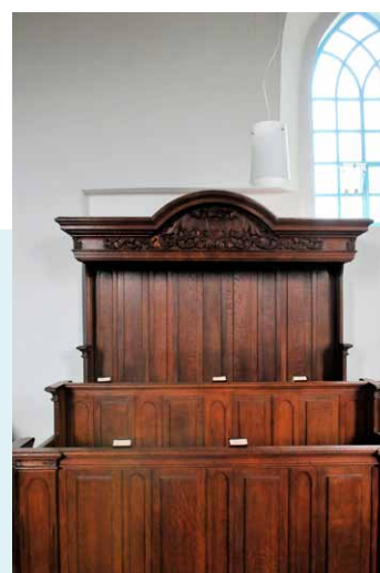
HERENBANK MET WAPEN FAMILIE IBEMA.