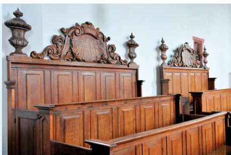
HERENBANKEN MET OPZETSTUKKEN VAN DE BEELDSNIJDER CASPER STRUIWIG.