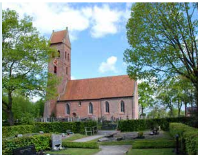
KERK VANUIT HET ZUIDEN

PREEKSTOEL De preekstoel is in opdracht van Georg Wilhelm vervaardigd door Allert Meijer en Menke Mollaan met houtsnijwerk van de hand van Jan de Rijk. De preekstoel van Uithuizermeeden heeft als voorbeeld gediend. Op de panelen van de kuip zijn de symbolen van de vier evangelisten aangebracht: de engel (Mattheus), de adelaar (Johannes), de leeuw (Marcus) en de os (Lucas). Het middenpaneel bevat een vanitas-voorstelling met voorwerpen die verwijzen naar de vergankelijkheid van het menselijk bestaan ( Prediker 1:2: 'Ijdelheid der ijdelheden en alles is ijdelheid' ). Op de hoeken staan beelden die zes van de zeven christelijke deugden voorstellen: Voorzichtigheid (slang en spiegel), Gerechtigheid (weegschaal en zwaard), Liefde (kinderen), Hoop (anker), Geloof (kruis en bijbel) en Sterkte/Standvastigheid (zuil).