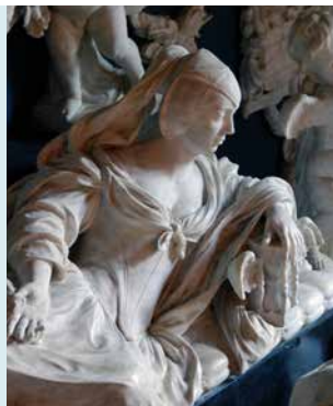
HET GRAFMONUMENT, ANNA VAN EWSUM

GRAFMONUMENT In 1664 gaf Anna van Ewsum opdracht aan de bekende beeldhouwer Rombout Verhulst om een grafmonument te vervaardigen voor haar in dat jaar overleden echtgenoot Carel Hieronymus von Inn- und Kniphausen. Verhulst had al naam gemaakt met enkele belangrijke praalgraven. Het monument was pas klaar in 1669; de vertraging werd vermoedelijk veroorzaakt door geldzorgen. De prijs voor het grafmonument: 3000 Nederlandse rijksdaalders. Carel Hieronymus ligt op een gevlochten mat van stro (of riet). Hij lijkt te slapen. De mat is, naast een symbool van wederopstanding, een hulpmiddel bij het afleggen. Het stro neemt vocht op. Zijn weduwe Anna ligt wat hoger achter hem. Haar linkerarm steunt op de Bijbel – een bewijs van Godsvertrouwen. Haar linkerhand rust op een gevleugelde zandloper: symbool voor de vliedende tijd. Achter Anna staat een brandende lamp, zinnebeeld van het leven. De schedel daarboven probeert de lamp uit te blazen. De putto aan de rechterkant staat met een voet op een schedel – de overwinning op de dood. Aan de linkerkant stond een putto met een gedoopte toorts en een zeis aan de achterkant – symbolen voor de dood. Deze putto is vervangen door een groot beeld van Georg Wilhelm von Inn- und Kniphausen, Anna's tweede echtgenoot. Dit beeld is gemaakt door Bartholomeus Eggers.