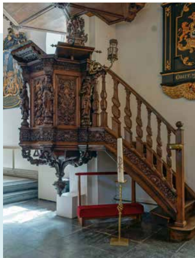
DE KANSEL MET FRAAI HOUTSNIJWERK

GRAFMONUMENT In 1664 gaf Anna van Ewsum opdracht aan de bekende beeldhouwer Rombout Verhulst om een grafmonument te vervaardigen voor haar in dat jaar overleden echtgenoot Carel Hieronymus von Inn- und Kniphausen. Verhulst had al naam gemaakt met enkele belangrijke praalgraven. Het monument was pas klaar in 1669; de vertraging werd vermoedelijk veroorzaakt door geldzorgen. De prijs voor het grafmonument: 3000 Nederlandse rijksdaalders. Carel Hieronymus ligt op een gevlochten mat van stro (of riet). Hij lijkt te slapen. De mat is, naast een symbool van wederopstanding, een hulpmiddel bij het afleggen. Het stro neemt vocht op. Zijn weduwe Anna ligt wat hoger achter hem. Haar linkerarm steunt op de Bijbel – een bewijs van Godsvertrouwen. Haar linkerhand rust op een gevleugelde zandloper: symbool voor de vliedende tijd. Achter Anna staat een brandende lamp, zinnebeeld van het leven. De schedel daarboven probeert de lamp uit te blazen. De putto aan de rechterkant staat met een voet op een schedel – de overwinning op de dood. Aan de linkerkant stond een putto met een gedoopte toorts en een zeis aan de achterkant – symbolen voor de dood. Deze putto is vervangen door een groot beeld van Georg Wilhelm von Inn- und Kniphausen, Anna's tweede echtgenoot. Dit beeld is gemaakt door Bartholomeus Eggers.