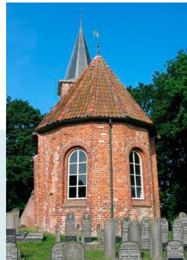
VIJFZIJDIG GESLOTEN KOOR

Zowel de noord- als de zuidgevel had oorspronkelijk een ingang. Het noordelijke (vrouwen)portaal is echter dichtgemetseld en deels verborgen achter een steunbeer. Tegenwoordig geeft alleen het zuidelijke (mannen)portaal toegang tot de kerk. Om het verzakken van de muren te voorkomen, werden in de tweede helft van de 18e eeuw aan de noord- en zuidzijde van het schip forse steunberen gemetseld.