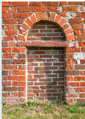
DICHTGEMETSELDE PRIESTERINGANG ZUIDGEVEL