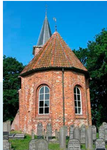
VIJFZIJDIG GESLOTEN KOOR

I N T E R I E U R De muren van toren, schip en koor zijn, zoals gebruikelijk in de beginperiode van de baksteenbouw, als kistwerk uitgevoerd. Tussen een binnen- en een buitenmuur bevindt zich een vulling van keien, gebroken en afgekeurde bakstenen en mortel.