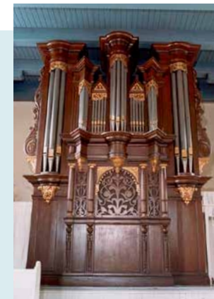
JOHAN REIMSCHMITT ORGEL 1658

In 1890 werd het complete binnenwerk door J. van Gelder vernieuwd. De overplaatsing naar de kerk van Marum en de restauratie van het orgel in 1939 werden uitgevoerd door de fa. Valckx en van Kouteren en co. Daarbij werd de dispositie iets gewijzigd en de intonatie herzien volgens inzichten van de adviserende Nederlandse Kloeken en Orgelraad. Het orgel heeft één manuaal met 10 stemmen en een aangehangen pedaal. Het instrument staat op een podium tegen de westmuur, de kas heeft een donkere imitatie-eiken kleur.