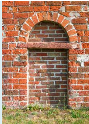
DICHTGEMETSELDE PRIESTERINGANG ZUIDGEVEL