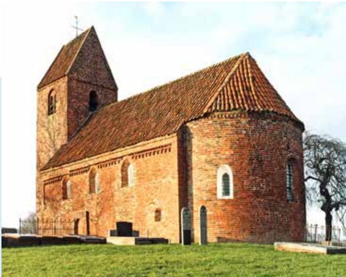
KERK GEZIEN VANUIT ZUID-OOSTEN

De ingang van de kerk zit tegenwoordig in de westmuur van de toren, de oude vrouwen- en manneningang zijn zowel binnen als buiten nog in de noord- en zuidmuur te zien, binnen compleet met de balkgaten voor de vergrendeling. De kerk werd in 1949-1951 gerestaureerd. Daarbij is de inrichting veranderd en kreeg de kapel in de toren een nieuw gewelf. In de toren hangt een klok met een afbeelding van de beschermheilige van de kerk en het opschrift: 's.mauritius bin ick geheten marsum heft mi laten geten ao 1620, johannes symon & anthonius filius petrus joly galli me fecerunt' .