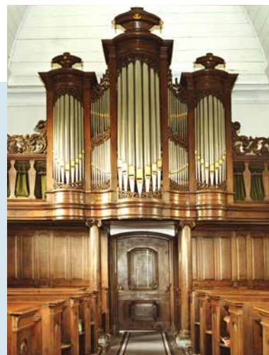
N.A. LOHMANORGEL, GEBOUWD IN 1830

Van 1978 tot 1982 werd het orgel opnieuw gerestaureerd door J.P. Vos en, na diens overlijden, S. Haarsma. Het instrument is geheel mechanisch. Windvoorziening: magazijnbalg. De handpompinstallatie met twee schepbalgen is nog aanwezig. Huidige dispositie: Manuaal (C-F ''' ): Prestant 8', Bourdon 16' (bas/disc.), Viola di Gamba 8', Holpijp 8', Octaaf 4', Fluit 4', Quint 3', Octaaf 2', Cornet III sterk (discant), Trompet 8', Tremulant, Ventiël. Het pedaal (C-d') is aangehangen.