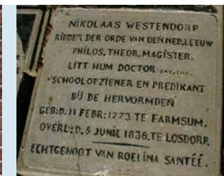
GRAFSTEEN DS. NICOLAAS WESTENDORP