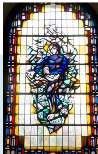
GLAS-IN-LOODRAMEN, GEPLAATST IN 1937

ORGEL Het orgel is in 1830 door N.A. Lohman gebouwd. Het snijwerk aan kast en galerij is gemaakt door Anthonie Walles in empire-stijl. De vaasbekroningen zijn nog op te vatten als Louis XVI-stijl. Het was oorspronkelijk een tweeklaviers orgel met aangehangen pedaal, met op het Manuaal zeven en op het Positief zes stemmen. In het begin van de twintigste eeuw was het orgel in een gebrekkige toestand geraakt, en in 1922 bouwde Orgelmakerij Bakker & Timmenga in deze kas een nieuw éénklaviers binnenwerk met tien stemmen. Zes stemmen van Lohman werden opnieuw gebruikt.