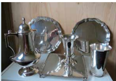
AVONDMAALSKAN 1940, SCHALEN 1934

De kerk bestaat uit drie traveeën. De aanwezigheid van lisenen doet op het eerste gezicht vermoeden, dat de kerk is gebouwd in de romano-gotische stijlperiode (1280-1400). Ook de nog aanwezige holle profielstenen ter plaatse van de dakvoet zouden kunnen wijzen op romano-gotische invloeden. Het metselwerk is echter tamelijk onsamenhangend uitgevoerd. Soms wordt kettingverband aangetroffen, soms wild verband. De voegen zijn vrij grof en de gebruikte kloostermoppen zijn niet erg strak en kantig. Verder worden in verhouding te veel koppen en klezoren aangetroffen. Hieruit valt af te leiden dat de kerk is gebouwd met afbraakmaterialen van een vroegere kerk of van een gebouw elders. Op de gebinten van de kerkkap zijn telmerken ingekapt, die te dateren zijn als rond 1600. Op de eikenhouten daksporen komen ingekapte romeinse cijfers voor. Deze telmerken zijn veelal laat-middeleeuws. De herbouwde kerk zou in hoofdvorm een reconstructie kunnen zijn van een romano-gotische voorganger.