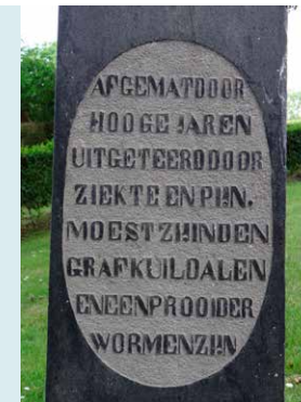
TEKST OP ACHTERZIJDE GRAFSTEEN.

De piscina is een nis in de koormuur met een open afvoer naar buiten. Bij het wegspoelen van de geconsacreerde hostieresten stroomde het heilige water zo op het kerkhof. Hierdoor kregen ook de doden op het kerkhof (op gewijde grond) deel aan het sacrament. Tijdens de Heilige Mis werd ook het water, gebruikt bij het ritueel van de handwassing, uit de zgn. Lavabo, dat letterlijk 'ik zal wassen' betekent, in de piscina gegoten. Het spreekwoord Gods water over Gods akker laten lopen refereert aan deze activiteit.