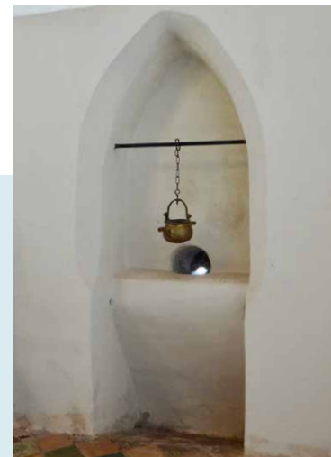
PISCINA MET LAVABOKETEL.

In het zuiderdwarspand is nog aanwezig het restant van de (d)oxaal. Deze zangtribune heeft vroeger over de volle breedte van de kerk gestaan (13,2 m hoog, 1,5 m breed en 4,3 m hoog). In de vloer zijn nog de stenen aanwezig waar de bogen ooit stonden. De Groninger schilder Henk Helmantel heeft hiervan een reconstructie geschilderd hoe het ooit moet zijn geweest. Onder het koor bevindt zich een 16e-eeuwse grafkelder waarin nog een blik te werpen is vanuit het luik onder de preekstoel.