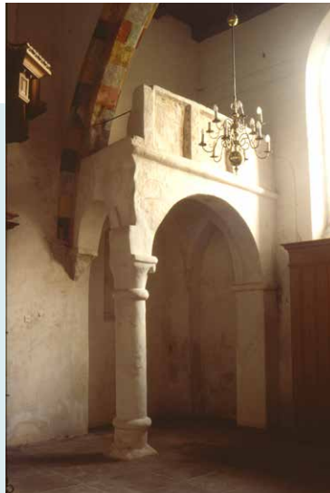
RESTANT VAN (D)OXAAL.

INTERIEUR De kerk heeft een houten zoldering in het schip en in het dwarschip, terwijl het koor afgedekt is met een koepelgewelf voorzien van beschilderde baksteenpatronen. In het interieur zijn muurschilderingen uit de vijftiende eeuw, waaronder die van de heilige Ursula. De 17e-eeuwse preekstoel is het enige overgebleven oude meubelstuk. De rest ging verloren bij een brand in 1957.