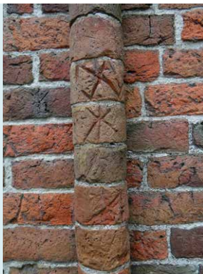
KOLONNET MET MERKTEKENS.

HAGIOSCOPEN In de noordkant van het schip bevinden zich drie zgn. hagiocopen. Bij twee ervan zijn zgn. knielnissen in de buitenzijde van de muur aangebracht. Een hagiocoop, zicht op het heilige, is een opening of een klein venster dat zich lager in de kerkmuur bevindt dan de overige ramen. De opening geeft zicht op het altaar, zodat buiten de kerk de heilige handelingen van de priester ook gevolgd konden worden. Mensen die niet in de kerk mochten komen, bijvoorbeeld lepralijders, konden zo toch de mis volgen. De venstertjes worden daarom ook wel leprozenvensters genoemd.