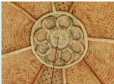
FRAAI BESCHILDERD KOORGEWELF.

MERKTEKENS Op een kolonnet -halfronde stenen kolom ter versiering- aan de oostelijke buitenkant van de koormuur zijn ooit een aantal merktekens aangebracht. Mogelijk de 'handtekening' van de bouwheren. Dat is vrij uitzonderlijk omdat de middel-eeuwers hun werk vrijwel nooit signeerden. Een andere versie is dan ook dat het symbolen zijn om onheil te weren, zoals ook de haan op de kerk, als teken van waakzaamheid, deze zou behoeden voor brand.