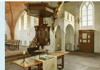
INTERIEUR MET FRAAIE PREEKSTOEL.