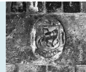
GRAFAANDUIDING JOHAN SCAFFER 1590 (SCAFFER).

ALTAARSTEEN In het koor van de kerk tegen de oostwand naast de preekstoel ligt een in tweestukken gebroken rode zandstenen altaarsteen. De wijdingskruisen zijn nog zichtbaar op de steen aanwezig. De steen stamt uit de periode van omstreeks de jaren 1400 tot 1700.