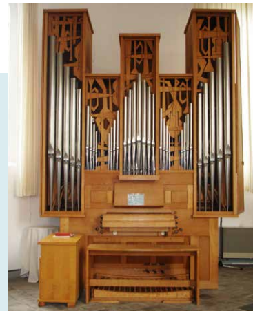
ERNST LEEFLANG ORGEL 1969, SINDS 1991 IN DEZE KERK.