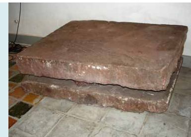
RODE ZANDSTENEN GEBROKEN ALTAARSTEEN.