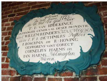
GENKSTEEN BOUW VAN DEZE KERK 1773.

INTERIEUR Binnen valt een eenvoudige ruimte te zien, die wordt afgesloten met een houten tongewelf. Tot 1888 stond op het kerkhof ook een losstaande toren met een luidklok uit 1638. Deze toren werd afgebroken toen aan de westkant van de kerk een nieuwe toren werd gebouwd. De gescheurde luidklok werd omgesmolten tot een nieuwe klok met het opschrift 'Gegoten door Gebr. Van Bergen uit Midwolda in 1888 van het metaal der voorgangster in 1638'. Ook het uurwerk in de toren is afkomstig van de Gebr. Van Bergen. In 1986 werd het gerestaureerd door J. Lodewegen. Willem Albert Scholten heeft bij de bouw van de nieuwe toren, in 1888, de ramen aan de kerk geschonken.