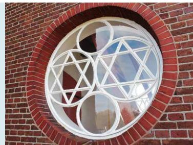
GEDENKRAAM TORENBOUW 1888, GESCHONKEN DOOR W.A. SCHOLTEN.

Bij de ingang van de torenhal ziet men de W.A. Scholtenramen. Deze ramen bestaan onder andere uit dubbele driehoeken. Met enige fantasie zijn in de dubbele driehoeken de letters W en A te onderscheiden.