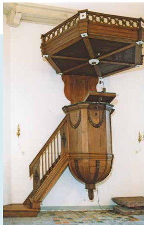
PREEKSTOEL 1800 UIT DE KERK VAN WEIWERD, SINDS 1986 IN DEZE KERK.