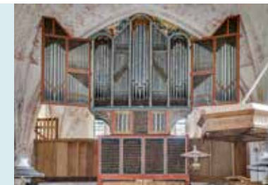
HET ORGEL 1531

Hieronder bevinden zich vier teksten die verhalen over andere restauraties die het instrument onderging in de loop der eeuwen. Tijdens de laatste restauratie werden in de blaasbalg van het orgel 15e- eeuwse fragmenten perkament aangetroffen met teksten over de Heilige Blasius, bisschop van Sebaste. Deze fragmenten komen waarschijnlijk uit een lectionarium, een liturgisch boek waaruit werd voorgelezen tijdens de mis. Door de weloverwogen restauraties is het orgel in zo'n goede staat dat het regelmatig wordt gebruikt voor concerten en opnames.