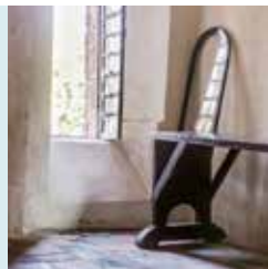
ONDER HET ORGEL