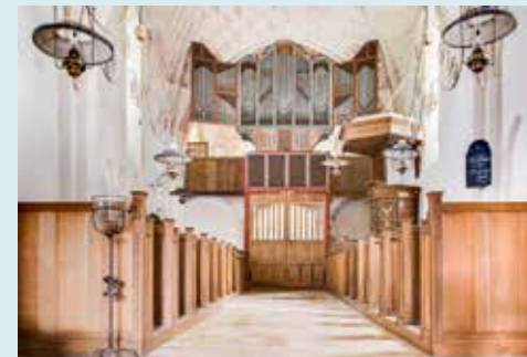
DOKSAAAL, WAAROP PIJPGEL'

ORGEL In 1531 werd het doksaal van de Mariakerk voorzien van een houten galerij waarop een pijporgel werd gebouwd. Dit orgel is het op een na oudste nog bespeelbare orgel van Nederland. De maker komt vermoedelijk uit de regio omdat hij stijlkenmerken heeft gebruikt uit de late gotiek en de renaissance. De orgelluiken zijn beschilderd met orgelpijpen (1643), zodat het pijpwerk groter lijkt. Onder de frontpijpen bevindt zich een houten plaquette met de volgende tekst: