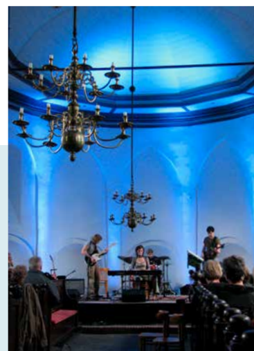
KERK ALS PODIUM VOOR MUZIEK, KUNST & CULTUUR