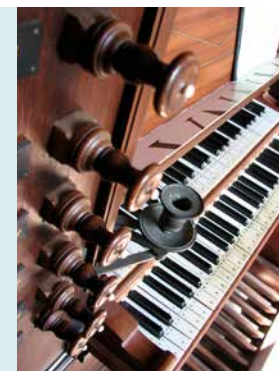
IN DE ZOMERMAANDEN WORDT HET ORGEL REGELMATIG BESPEELD

Op het orgel staan drie basreliëfs van de hand van S. van Lekkum, geplaatst tijdens een orgelrestauratie in 1876. Van links naar rechts wordt geloof, hoop en liefde uitgebeeld. In het fraaie houtsnijwerk van de orgelbalustrade zijn de wapens van de geslachten Lewe van Aduard en Alberda en enkele muziekinstrumenten verwerkt. De familie Lewe van Aduard had het recht om in zijn eentje de dominee te benoemen (unicus collator) verworven als onderdeel van hun streven om hun macht in de Ommelanden uit te breiden. In 1815 is het 'collatierecht' door de gemeente Garnwerd/Oostum teruggekocht voor 2100 gulden.