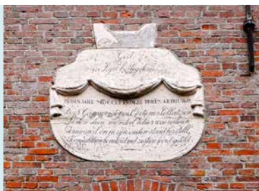
GEDENKSTEEN MET OPSCHRIFT UIT 1816 BOVEN DE INANG

Binnen in de toren bevinden zich een grote zerk uit 1538 en een met zonnerraden versierd sarcofaagdekse l van Bremer zandsteen uit de 12e of 13e eeuw. Deze zijn gevonden bij de restauratie van de kerk in de jaren zeventig van de vorige eeuw en toen hier geplaatst. De klok is in 1943 door de Duitsers weggehaald. Op 4 juni 1949 kwam daar een nieuwe voor in de plaats, gegoten door de firma Van Bergen.