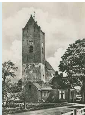
KERK OMSTREEKS 1964

INTERIEUR De kansel uit het begin van de 18e eeuw wordt omgeven door een eenvoudig doophek. De herenbank met rococoversieringen komt uit de late 18e eeuw. Opvallend zijn de vijf boogvormige nissen in het halfronde koor. In dit oudste gedeelte van de kerk staat een kleine barokke avondmaalstafel met marmeren blad uit de late 17e eeuw. Het kleine nisje in de meest zuidelijke boog is mogelijk een overblijfsel van een hagoscoop. Naast de preekstoel ziet u nog een oud raam dat bij de restauratie in de jaren zeventig tevoorschijn is gekomen. In de kerk hangen twee koperen achtkantige lichtkronen uit 1843.