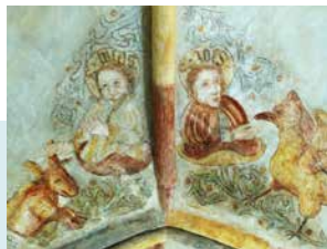
DE EVANGELISTEN LUCAS EN JOHANNES

In de noordelijke dwarsarm: de Mariacyclus : aankondiging van de geboorte, de stal, aanbidding door de drie wijzen, en sterfbed en Tenhemelopneming van Maria. In de zuidelijke dwarsarm: de Christuscyclus : Christus in de Hof van Olijven, Christus voor Pontius Pilatus, de kruisiging, en de verrijzenis.