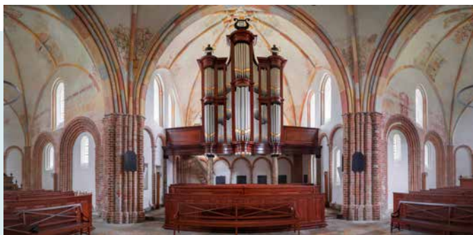
INTERIEUR GEZIEN VANAF DE KANSEL

De muurresten op het kerkhof, aan de westzijde van de kerk, laten zien tot waar de kerk oorspronkelijk liep. Duidelijk is ook te zien waar de opengebroken kerk weer werd dichtgemaakt.