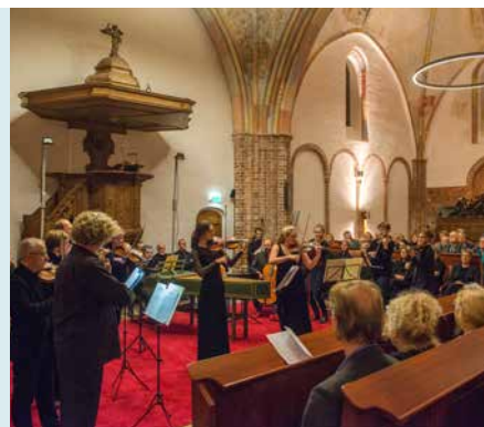
KERK ALS PODIUM VOOR MUZIEK, KUNST & CULTUUR