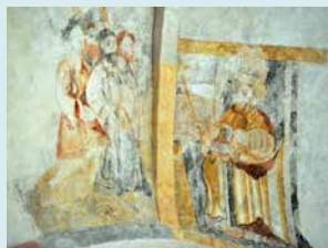
CHRISTUS VOOR PONTIUS PILATUS