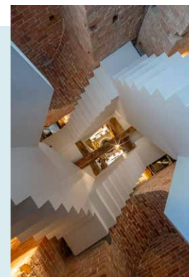
INTERIEUR TOREN

In de toren is op een spectaculaire Escher-achtige trap de interactieve tentoonstelling Feest! In Oost en West : acht feesten uit de christelijke en islamitische traditie komen er tot leven. Helemaal bovenin is een uitkijkpunt over het weidse Groninger land.