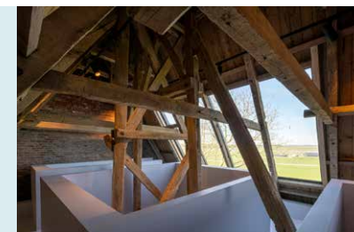
BOVEN IN DE TOREN