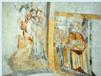
CHRISTUS VOOR PONTIUS PILATUS