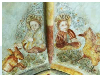
DE EVANGELISTEN LUCAS EN JOHANNES

In de zuidelijke dwarsarm: de Christuscyclus : Christus in de Hof van Olijven, Christus voor Pontius Pilatus, de kruisiging, en de verrijzenis.