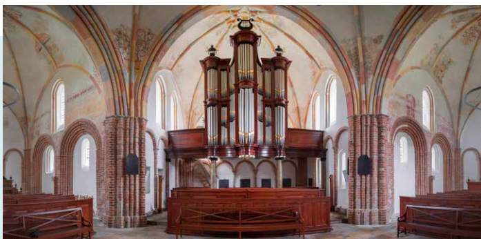
INTERIEUR GEZIEN VANAF DE KANSEL

De muurresten op het kerkhof en de maquette, aan de westzijde van de kerk, laten zien hoe de kerk er oorspronkelijk uitzag. Duidelijk is ook te zien waar de opengebroken kerk weer is dichtgemaakt.