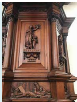
PREEKSTOEL MET ALLEGORISCHE VROUWEN FIGUREN, 1806