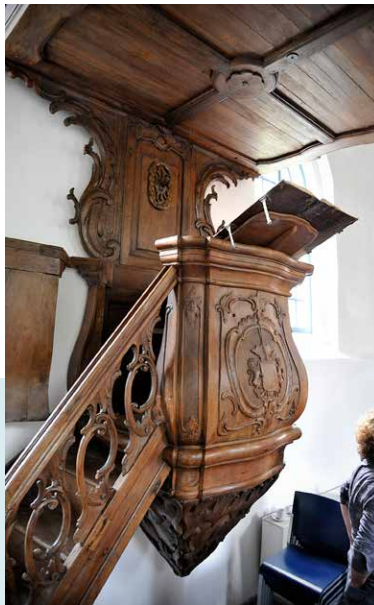
PREEKSTOEL, AFKOMSTIG UIT DE KERK VAN HEVESKES

De westgevel met de ingang is van veel latere datum. In deze westgevel zijn aan weerszijde van de ingang rondbogige vensters aangebracht en boven de ingang is een rondvenster geplaatst. Het kerkgebouw is in 1904 grondig 'vernieuwd'. In de dakruiter hangt een klok uit 1949.