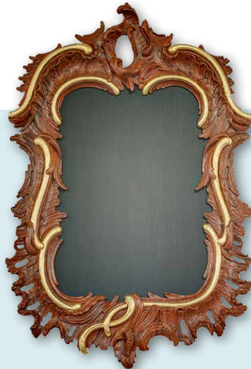
PSALMBORD, AFKOMSTIG UIT DE KERK VAN TERDUM

Aan de wanden hangen drie liedborden afkomstig uit de kerk van Oterdum. Deze liedborden in rococo-stijl passen goed bij de eveneens in deze stijl uitgevoerde preekstoel. De kerk van Engelbert fungeert zo als bewaarplaats van goede herinneringen en kan hier mee ook het verhaal vertellen van Heveskes en Oterdum.