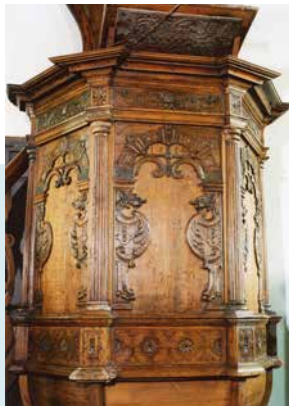
EIKEN PREEKSTOEL UIT 1654 MET OPGELEGD SIERLIJKE KLAUWSTUKKEN