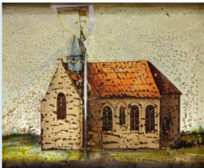
GEBRANDSCHILDERD RAAM AFKOMSTIG UIT HUIS TE EENUM, AFMETINGEN 25 X 22 CM. DATUM ONBEKEND

In de 16e eeuw zijn in de zuidgevel de huidige grote gotische ramen ingebroken. In de noordgevel zijn alleen de smalle romaanse ramen naar beneden toe verlengd. In 1845 is de oorspronkelijke halfronde absis aan de oostkant van de kerk afgebroken en vervangen door een rechte muur. De grafzerken die eerder in het koor lagen liggen nu buiten.