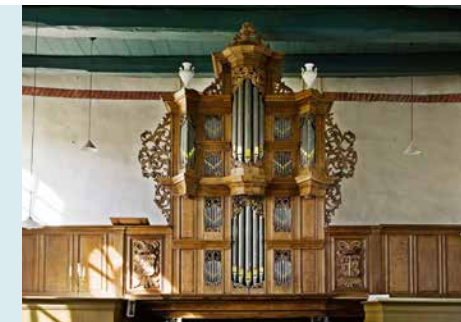
ORGEL OP GALERIJ, GEBOUWD DOOR ARP SCHNITGER IN 1704