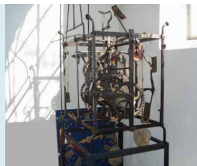
SMEEDIJZEREN TORENUURWERK 1636