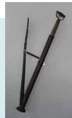
KOPEREN WATERSPUIT VOOR HET WASSEN VAN DE KERKRAMEN, IN DE TIJD DAT ER NOG GEEN WATERLEIDING WAS