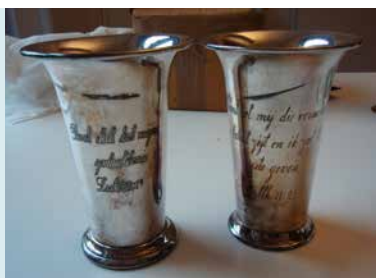
AVONDMAALSBEKERS UIT DE ADORPER KERK

Op de kaarten van Haubois (1643) en Coenders (1680) is de losstaande toren, die in deze tussentijd is verhoogd, zichtbaar. Het grondvlak mat zeker 5 bij 5 meter. In deze toren bevond zich de klok uit de afgebroken kerk van Harssens. De klok is gegoten in 1618 door Henrick Wegewart. De kerk van Harsens is afgebroken in 1794. Voor de losstaande toren kwam een dakruiter in de plaats, met daarin bovengenoemde klok. Om de plaatsing van de dakruiter mogelijk te maken, werd een raam dat eerder in de westgevel zat dichtgemetseld.