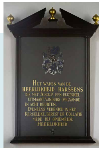
WAPENSCHILD MET HET WAPEN VAN DE HEERLIJKHEID HARSENS

INTERIEUR U ziet het originele, volledig protestantse interieur van 1667 met steile banken, dooptuin, herenbanken en preekstoel. Slechts het sacramentsnisje links in het koor herinnert nog aan de roomse tijd.