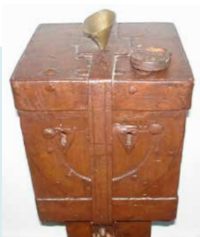
OFFERBLOK (17E EEUW) ONDER DE KANSEL