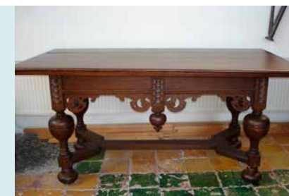
AVONDMAALSTAFEL (17E EEUW)