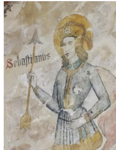
Sebastiaan met pijl in de hand in de kerk van Bierum

Sebastiaan werd al vroeg een belangrijke pestheilige vanwege de pijlen waar hij vaak mee afgebeeld werd. Er werd geloofd dat de pest een straf van God was die door engelen met pijlen naar de mensen geschoten werd, zoals de Griekse god Apollo ook mensen strafte. In 680 brak de pest uit in Rome en het aanroepen van heiligen zou enorm geholpen hebben. Vanaf dat moment werd Sebastiaan enorm populair als pestheilige. De marteling met pijlen die hij onderging, vormt ook de basis voor zijn patronaat van voornamelijk handboogschutters die zich in gildes groepeerde ter bescherming van steden. Sebastiaan is ook een belangrijke beschermheilige van onder meer atleten, ijzerhandelaars, borstelmakers, tuiniers, lakensnijders, militairen, speldenmakers en rioolarbeiders. Ook werd hij een beschermheilige van homoseksuelen, omdat hij al in vroege afbeeldingen als bijna geheel naakte man te zien is. In de provincie Groningen was hij bij de stichting de patroonheilige van de kerk in Eenrum (samen met Fabianus), de Donatuskerk in Leermens (samen met Donatus en Fabianus) en waarschijnlijk ook van de Sebastiaankerk in Bierum.