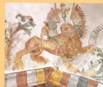
Leeuw, symbool van evangelist Marcus met grote scheuren door gewelfribben, pleisterwerk en muurschildering

Schades aan gebouwen, dus ook aan kerken kunnen ontstaan zijn door 'dynamische krachtwerking' in de bodem. Dat betekent dat, als er een aardbeving plaatsvindt die trillingen in de bodem veroorzaakt, er schade kan ontstaan of verergeren met scheuren als gevolg. Dat