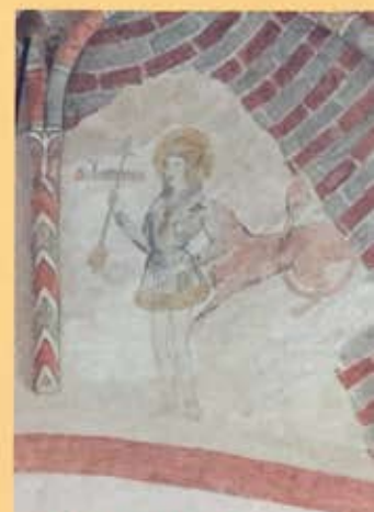
Sint Sebastiaan in Bierum

In meerdere kerken van de stichting Groninger Kerken moet schadeherstel en bouwkundige versterking vanwege aardbevingsschade plaatsvinden.