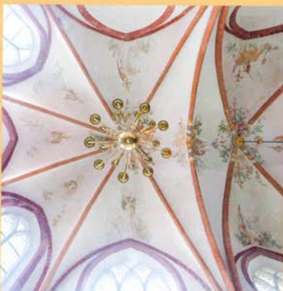
Gewelf absis Mariakerk

De muren en gewelfvlakken werden vervolgens versierd met Bijbelse en figuratieve muurschilderingen. Op de gewelven in het koor is een grote reeks van motieven en voorstellingen te zien: Christus als de Man van Smarten, de vier symbolen van de evangelisten, engelen, een sirene (mythologisch beeld van de verleiding), een hert (de ziel), een haan (waakzaamheid), een uil (wijsheid) en een pelikaan (offerbereidheid).