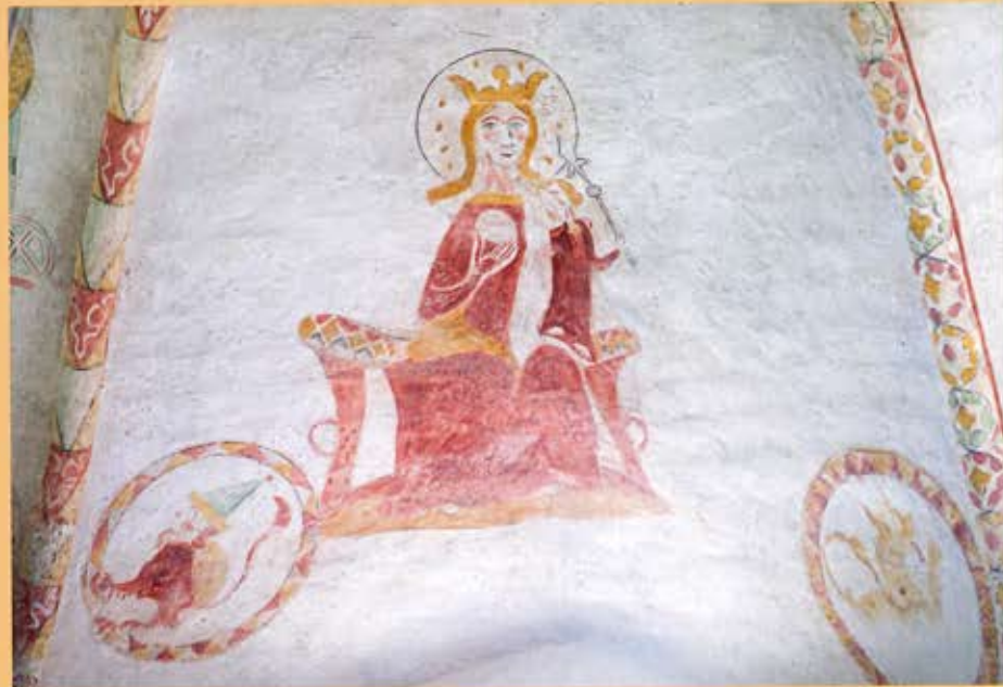
Maria met kind