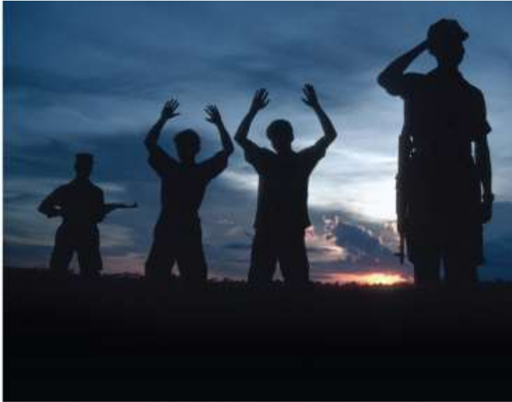
Foto van de cover van het boek 'Inleiding Humanitair Oorlogsrecht', geschreven vóór het Nederlandse Rode Kruis, door: Arjen Vermeer, Boukje Pieters & Miriam Bruinsma, uitgegeven door: T.C.M. Asser Press, hernieuwde druk, 2017

Het humanitair oorlogsrecht is bedoeld om de schadelijke effecten van gewapende conflicten te beperken. Tijdens de Tweede Wereldoorlog vonden miljoenen gruwelijke schendingen van dit recht plaats door aanvallen op burgers. Ook tegenwoordig vinden zulke schendingen plaats, bijvoorbeeld in Syrië.