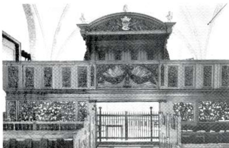
Het herengestoelte behoorde aan de adellijke familie Alberda van Menkema.