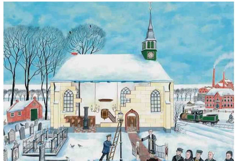
ILLUSTRATIES STEFAN DE KEIJSER

'De kerk is vol van brandstof voor de verbeelding'