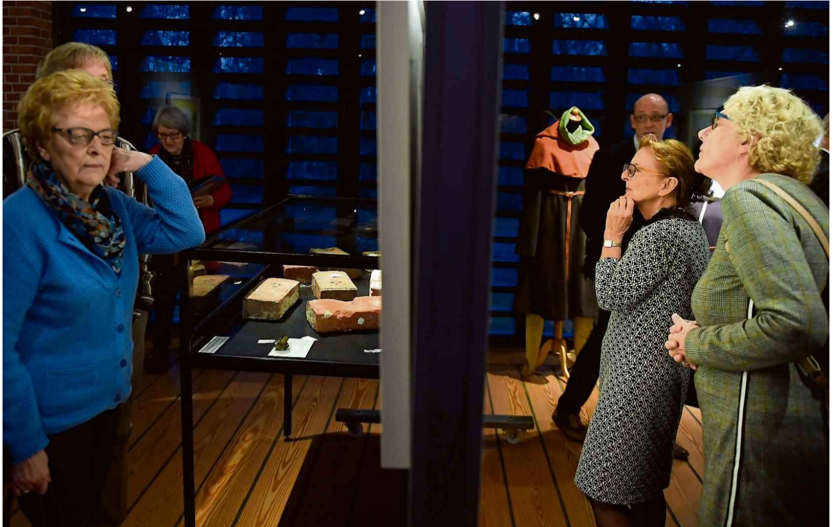
Bezoekers aan de tentoonstelling De kerk als tijdmaschine in Museum Klooster Ter Apel.