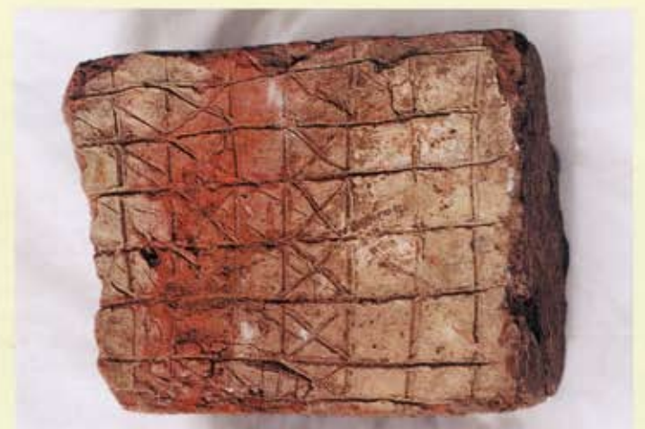
10. Midwolda, afkomstig van een boerderij, nu in collectie te Tinallinge. Steen met ruitpatroon en kruisjes.