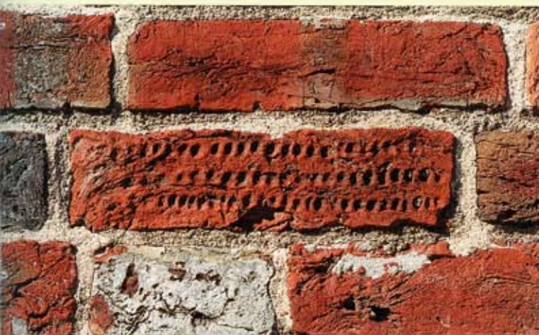
17. Bierum, zuidgevel van de kerk. Steen met door instrument ingestoken gaten.