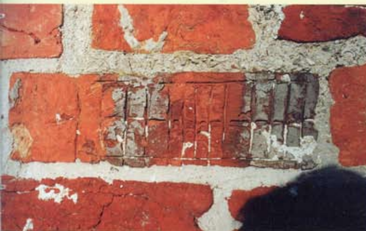
9. Logabirum, zuidgevel van de kerk. Steen met ruitpatroon.