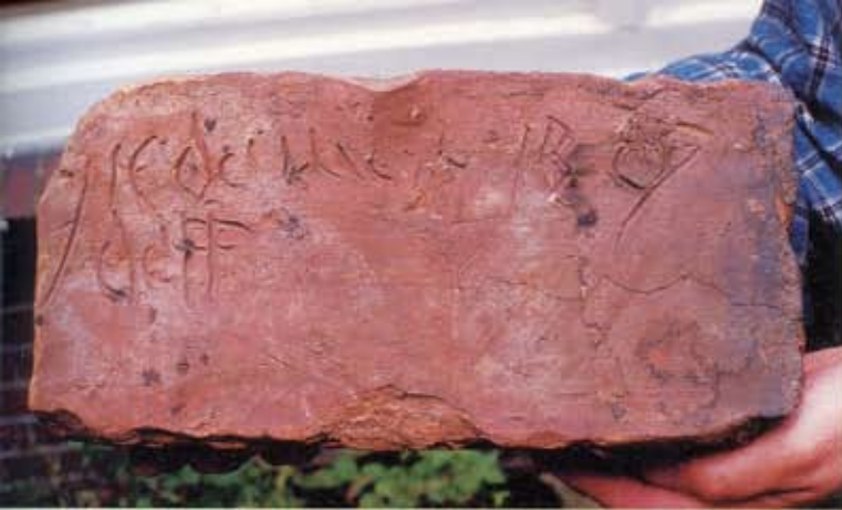
19. Ter Apel, afkomstig uit de kloosterhof, nu in particulier bezit ter plaatse. Steen met ingeschreven tekst.