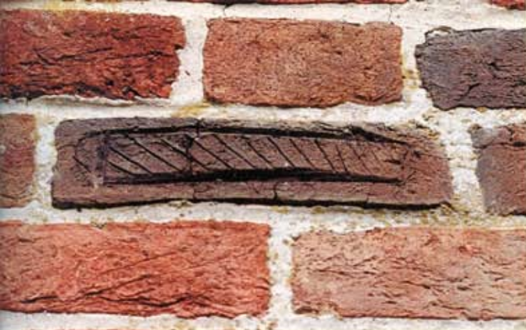
3. Den Andel, zuidgevel van de kerk. Steen met parallelle lijnen.