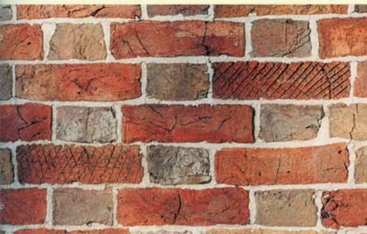
7. Wiesens, zuidgevel van de kerk. Stenen met ruitpatronen.