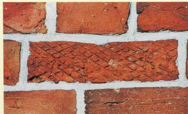
8. Bagband, zuidgevel van de kerk. Steen met ruitpatroon.