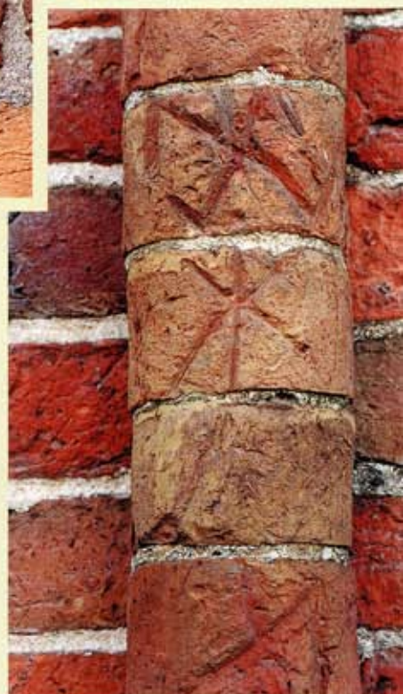
14. Leermens, oostgevel. Colonne met drie stenen met handmerken, na het bakken aangebracht.