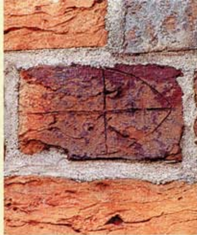
12. Wiesens, noordgevel van de kerk. Steen met meetkundige figuur.