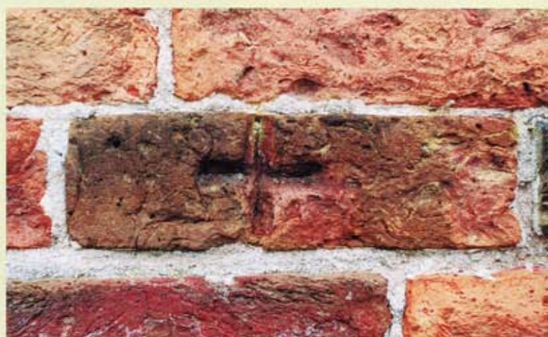
26. Kantens, zuidgevel van de kerk. Steen met ingehakt of ingeslepen kruis.