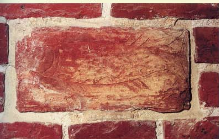
23. Eenrum, noordwand van de toren. Steen met ingegrifte vis.