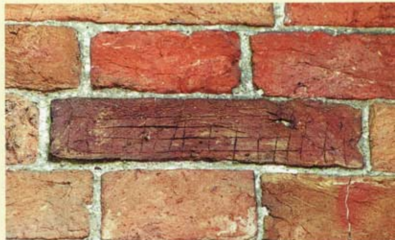
6. Thesinge, noordgevel van het koor. Steen met ruitpatroon.