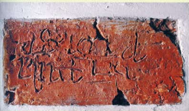
21. Zweeloo, afkomstig uit de onderste laag van de fundering. Steen met ingeschreven tekst. Twee lezingen zijn mogelijk: zoals de steen is ingemetseld, of (waarschijnlijk correct) ondersteboven.