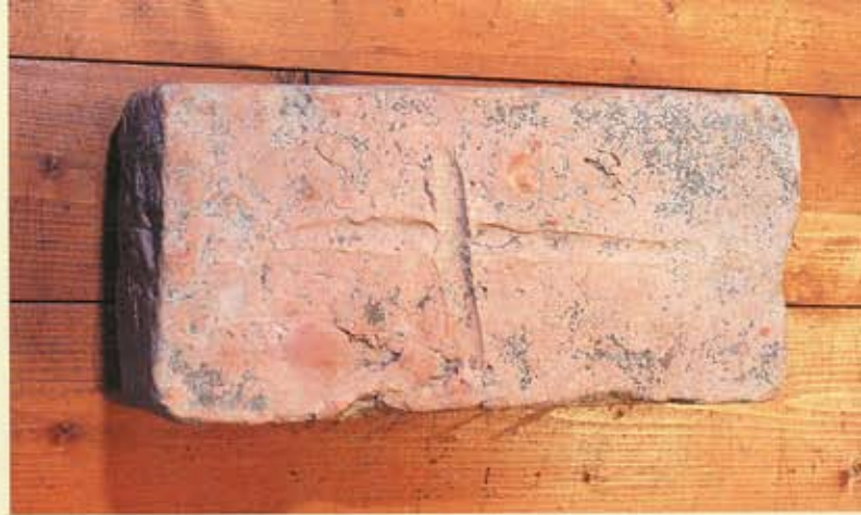
4. Groot Wetsinge, afkomstig van het kerkhof, nu in collectie-Reinders, Middelstum. Steen met kruis.