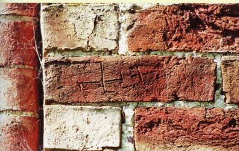
15. Thesinge, zuidgevel van het koor. Steen met twee handmerken.