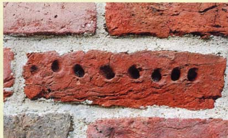
18. Eggelingen, zuidgevel van de kerk. Steen met door vingers ingestoken gaten.