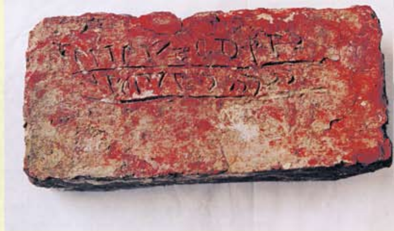
20. Tinallinge, afkomstig uit de kerkmuur, nu in verzameling ter plaatse. Steen met ingeschreven en onderstreepte tekst.