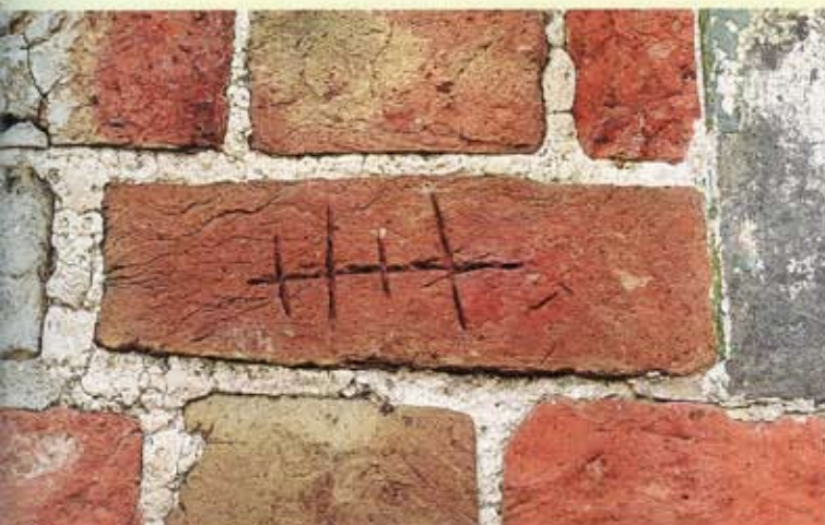
5. Krewerd, noordgevel van de kerk. Steen met 'turfje' (telmerk?).