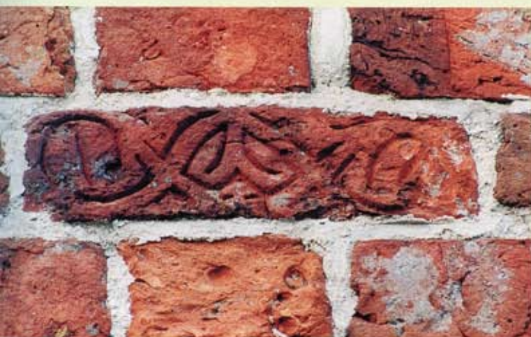
25. West-Ochtersum, zuidgevel van de toren. Een van de tenminste acht stenen met stempelafdruk van gestileerde ranken.