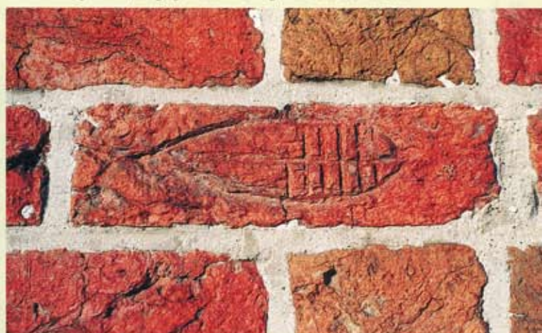
24. Zuidlaren, zuidgevel van de kerk. Steen met ingegrifte vis.