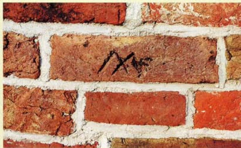
16. Nuis, zuidgevel van de kerk. Steen met letter M (of handmerk?), na het bakken aangebracht.